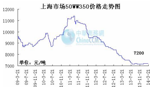
2、上海市场 50WW350 周价格走势图

本周中高牌号无取向硅钢价格稳中偏弱，钢贸商资源进一步减少。武钢检修对市场影响不大。主要是钢厂高牌号产能释放及原料成本下降，促使高牌号无取向硅钢有进一步下行趋势。需求表现一般。目前 50WW350 维持在 7200 元/吨左右，部分市场成交在 7100 元/吨左右。