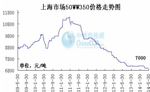
2、上海市场 50WW350 周价格走势图

本周中高牌号无取向硅钢则呈缓慢下降态势，部分牌号较上周略降30-50元。今年预计产量能达到65-70万吨，约占整体无取向硅钢产量的10%左右，由于高牌号相对低牌号利润较高，预计仍有下降空间。目前50WW350上海市场报在6950元/吨左右。