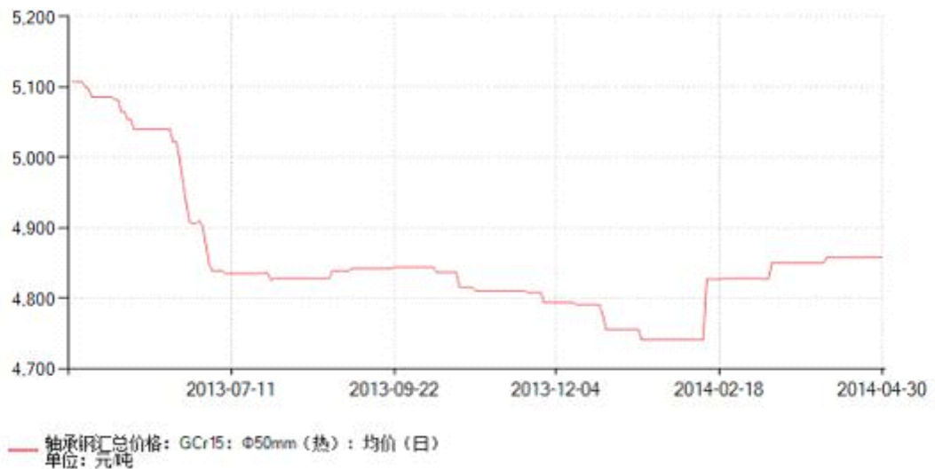
图 3：2013-2014 年国内轴承钢连铸材平均价格走势图

4 月国内各地轴承钢价格情况：杭州市场，中规格 GCr15（连铸不退火）主流价格在 4500 元/吨。洛阳市场，中规格 GCr15（连铸不退火）主流价格在 4750 元/吨，模铸退火 GCr15 主流价格在 7800 元/吨左右。西安市场，中规格 GCr15（连铸不退火）主流报价 4900 元/吨，模铸退火 GCr15 主流价格 7500 元/吨左右。沈阳市场，中规格 GCr15（连铸不退火）主流价格 4100 元/吨，模铸退火 GCr15 主流报价 6400 元/吨。