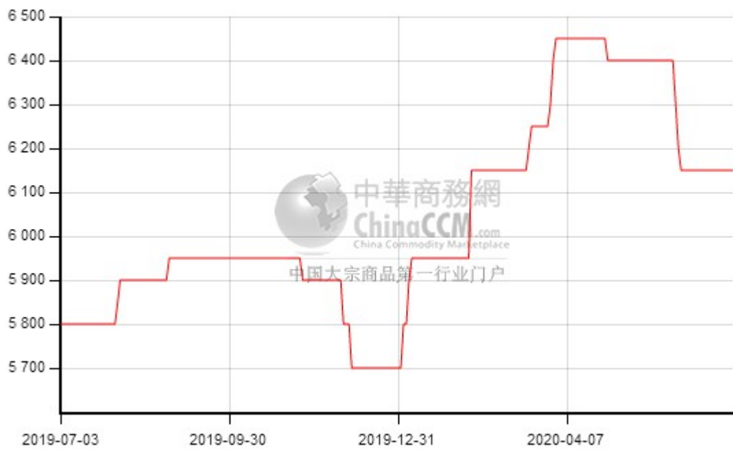
图三：上海市场武钢 350 价格走势