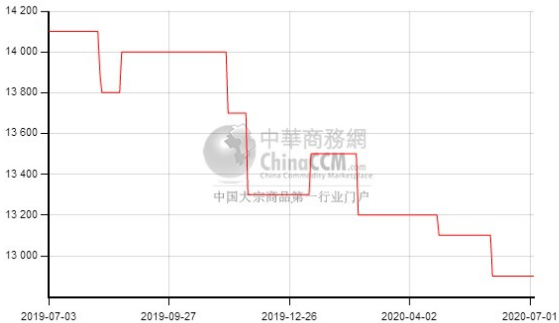
图五：取向硅钢 B23R085 价格走势