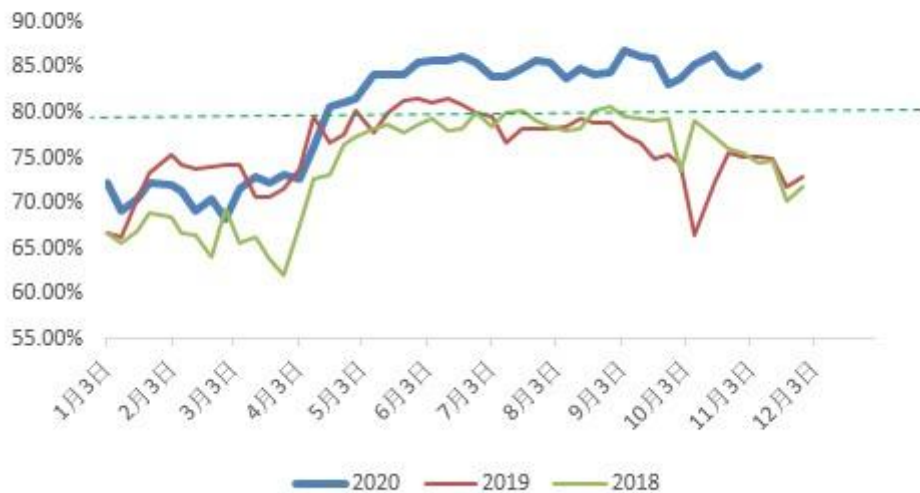
全国37家中厚板钢厂产能利用率及同比

2020年中厚板年平均产能利用率高于去年同期水平。从2019年起，随着钢厂环保设备陆续改造完成，以及环保治理的精细化，科学化，钢厂自身受限产影响的程度在不断减小，2020年全年除去受疫情影响较大的2月和3月，全年产能利用率较去年同期相比都有较明显的提升。此外，今年新增轧线相继投产使得中厚板产能继续处于扩张期，在第四季度的秋冬限产对中板品种的产能有了一定程度的限制，产出略有收缩。盈利情况较去年相比水平基本相当，吨钢差距不明显，全年来看，中厚板在板材品种里利润还处于中上等的水平。